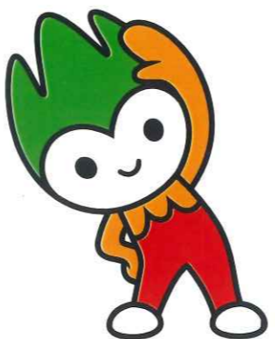
山口県PR本部長ちよるる